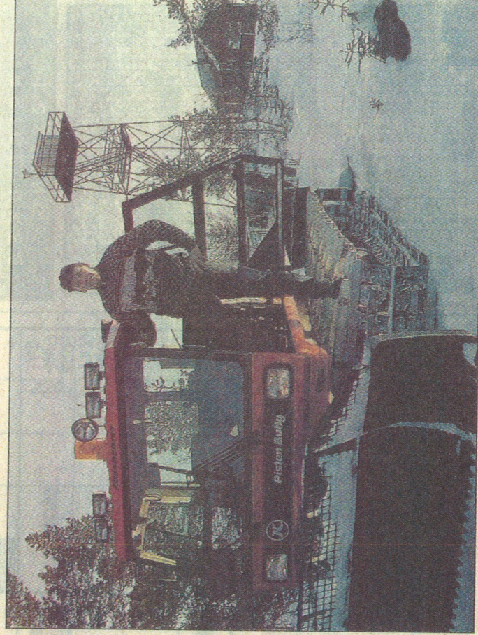
FLOTTE LØYPER: Terje Urdal er en av mange som sørger for å holde seks mil med skiløyper på Vestmarka åpne. Han oppfordrer folk til å gå turen fra Svennebysetra til Blåenga for å nyte utsikten.