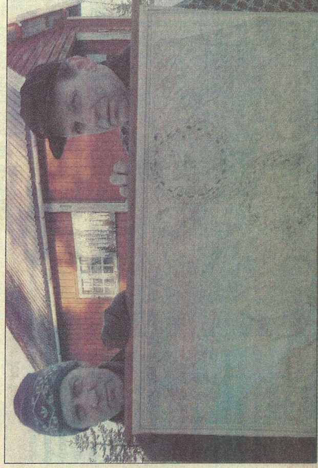
KART: Ved hjelp av gradeinndeling på kart og telefonkontakt med andre vaktstasjoner kunne brannvaktene bestemme ganske nøyaktig lokalisere en skogbrann. Også for luftforsvaret har systemet av brannvaktstasjoner hatt en viktig funksjon.