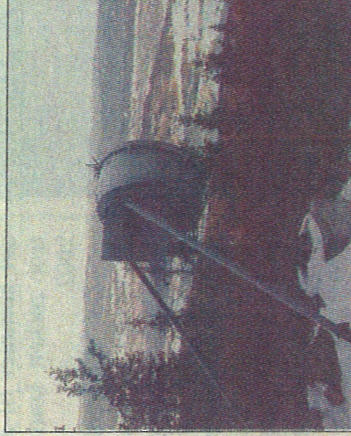
HEMMELIG: Helt siden mellomkrigsårene har Forsvaret brukt Blåenga som lyttepost mot fremmede fly. I dag er det moderne telekommunikasjonsnett og elektronikk som sørger for å holde fremmede makter unna.